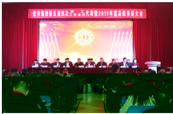
1 a 19日, 宏河集团第五届四次职代会(工代会)暨2019年度总结表彰大会在横河煤矿职工bc召开。

! " # $ % & ' ( ) * + , ) * - . 2019 / 01 2345 * 67, 89: +; <-